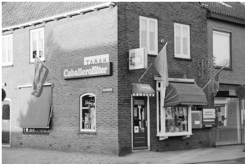
Sigarenmagazijn Verwoerd toen er nog reclame mocht worden gemaakt.

Aan de buitenkant van de winkel mag geen merkreclame gemaakt worden, terwijl de reclame in de etalage slechts binnen twee meter leesbaar mag zijn. Sigaretten van veel merken worden door British American Tobacco (BAT) gemaakt, terwijl ook Philip Morris een belangrijk marktaandeel heeft en in Nederland in licentie merken als Marlboro en Chesterfield produceert. De hoge verkoopprijs van sigaretten heeft met name te maken met de 78% accijns en BTW die moeten worden betaald. Voor sigaren is de winstmarge voor de sigarenboer wat hoger. Samen met de exploitatie van tachtig sigaretten-, snoep- en frisdrankautomaten in de regio en de inkomsten uit Staatsloterij en Lotto is het sigarenmagazijn rendabel. Daarbij komt dan nog eens de verkoop van vuurwerk aan het eind van het jaar. Het spreekt voor zich dat familie Hazeleger door verschillende personeelsleden in hun winkels terzijde wordt gestaan.