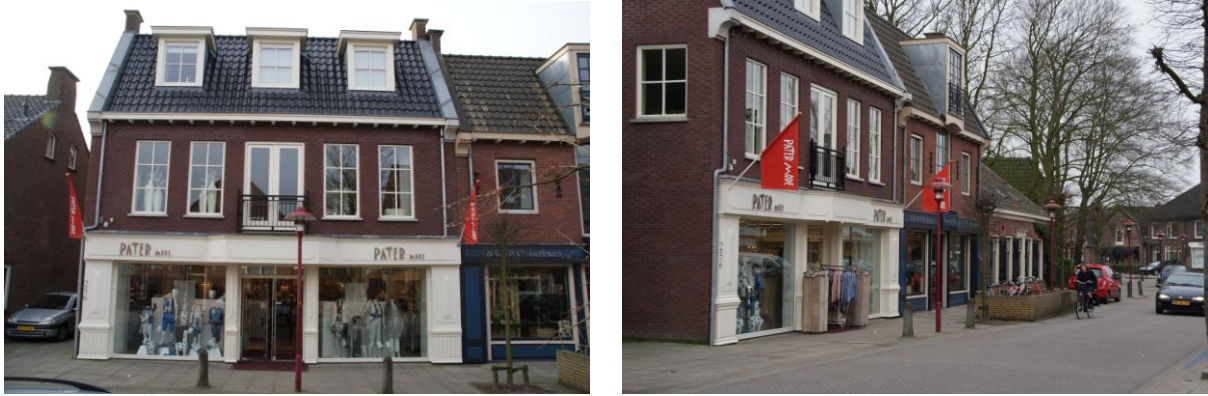
Pater Mode, 2011.