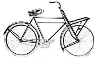
ERIS TRANSPORT Prijzen zie nevenstaand