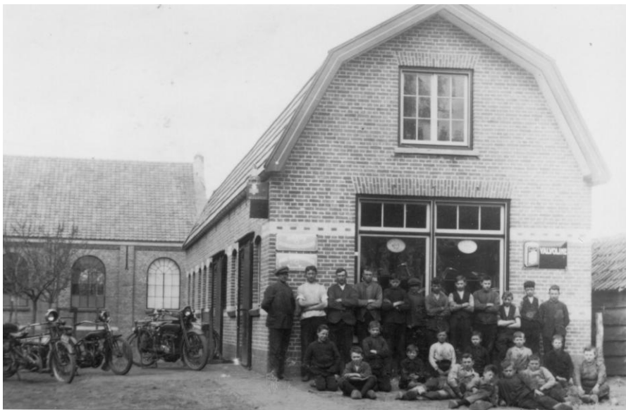
Rijwiel en motorhandel Cortus.