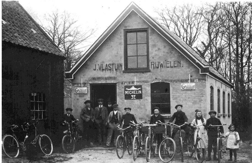
Eris in 1913.

Nederland staat bekend als fietsland. Ook in Scherpenzeel wordt veelvuldig gefietst, vaak op rijwielen van Nederlands fabricaat. Wat dat betreft is er niet zoveel veranderd ten opzichte van vroeger. Alleen fietsten Scherpenzeelers toen regelmatig op fietsen die hier ter plaatse waren gefabriceerd. Oud-Scherpenzeel besteedt vandaag aandacht aan de geschiedenis van de Scherpenzeelse rijwielhandelaren en de Eerste Rijwielindustrie Scherpenzeel (Eris).