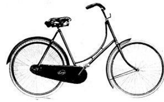
ERIS RIJWIELEN Prijzen zie nevenstaand