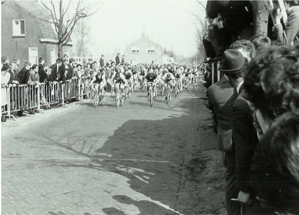
Ronde van Scherpenzeel op de Glashorst, 1967.