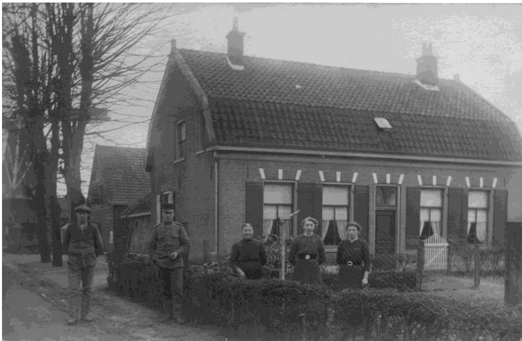
Afbeelding: de familie van Harten voor het molenaarshuis.

Het bij de molen behorende molenaarshuis stond aan de Stationsweg en was een langer leven beschoren. Het is in 1995 gesloopt en vervangen door een dubbel woonhuis.