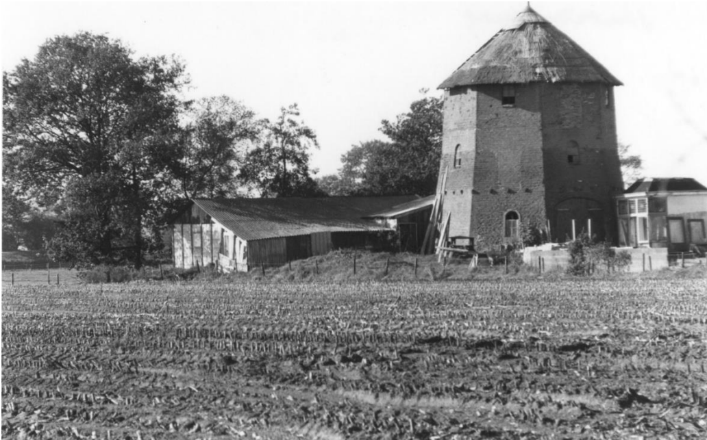
Afbeelding: de resterende molenromp, hier nog met rieten kap (foto omstr. 1980)

De molen stond eerst op grondgebied van Woudenberg, maar na de grenswijziging van 1 januari 1960 staat de molen op Scherpenzeels grondgebied.