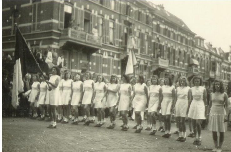
Doto op de Bondsdag, 1936.