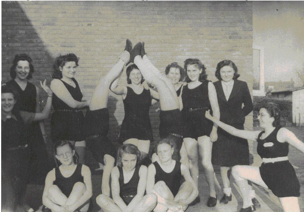
Dames in de jaren vijftig.