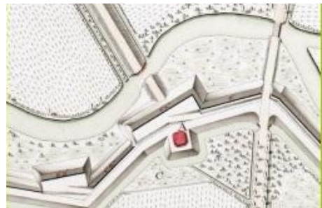
de plaats van de oude toren ('t redoute)

De nieuwe eeuw brengt na meer dan 200 jaar inzicht. De culturele waarde van het eeuwenoude stelsel wordt eindelijk ingezien, en men begint over de gehele linie met uitgebreide herstelwerkzaamheden, en waar nodig restauraties en zelfs reconstructies. Zo ook de Lambalgerkeerkade (en omgeving). Er zijn plannen om het dijkprofiel en de geschutsementen weer in oorspronkelijke vorm terug te brengen. Alle overbodige begroeiing van de afgelopen vijftig jaar is inmiddels verwijderd. De oude veldschans wordt hersteld, en wellicht dat de oude Spaanse Redoute, die stenen toren uit lang vervlogen tijden in het verlengde van de kade, weer herbouwd wordt.