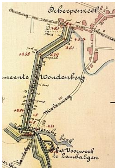
toestand rond 1870

De keerkade sloot aan op de linedijk. In de Broek(er)sloot, zoals die op de kaart uit 1870 genoemd wordt, (nu Valleikanaal) was in het verlengde van de keerkade een damsluis gebouwd. De naam zegt het al, door middel van schotbalken kon de Broekerssloot worden afgedamd, waarna het water werd opgestuwd en de landerijen overstromden. De keerkade voorkwam dat het water naar het noordwesten weg kon vloeien.