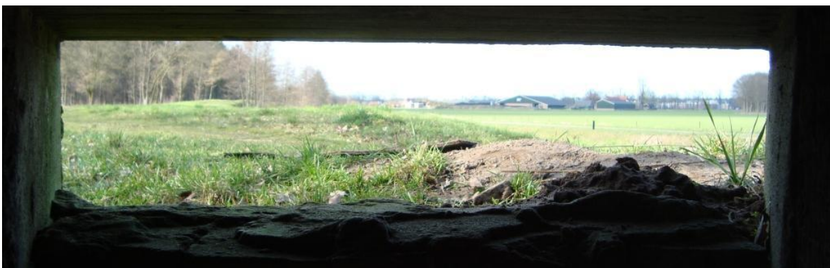
zicht vanuit de veldlegerkazemat op de liniedijk, richting Woudenberg; direkt rechts, haaks op de dijk (op de foto niet zichtbaar) ligt de Lambalgerkeerkade

Dit veranderde drastisch in de jaren 1939 - 1940. Generaal Winkelman nam het besluit om de Grebbelinie tot de hoofdverdedigingslinie te maken, waarna in allerijl de linie werd versterkt. Met de grootst mogelijke haast werden betonnen kazematten overal in en op de linie ingeplant. De Lambalgerkeerkade vormde een verhoging in het terrein, waarover de vijand zou kunnen naderen. Een frontale kazemat voor zware mitrailleur (type Szw) moest dat verhinderen. De dijk zelf werd verder niet versterkt; in plaats daarvan richtte men in Scherpenzeel een aantal voorposten in, die de eerste weerstand konden bieden.