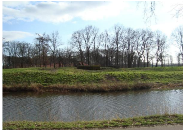
de kazemat Szw (frontaal stekelvarken) op de liniedijk; rechts daarachter ligt de veldlegerkazemat

Dit veranderde drastisch in de jaren 1939 - 1940. Generaal Winkelman nam het besluit om de Grebbelinie tot de hoofdverdedigingslinie te maken, waarna in allerijl de linie werd versterkt. Met de grootst mogelijke haast werden betonnen kazematten overal in en op de linie ingeplant. De Lambalgerkeerkade vormde een verhoging in het terrein, waarover de vijand zou kunnen naderen. Een frontale kazemat voor zware mitrailleur (type Szw) moest dat verhinderen. De dijk zelf werd verder niet versterkt; in plaats daarvan richtte men in Scherpenzeel een aantal voorposten in, die de eerste weerstand konden bieden.