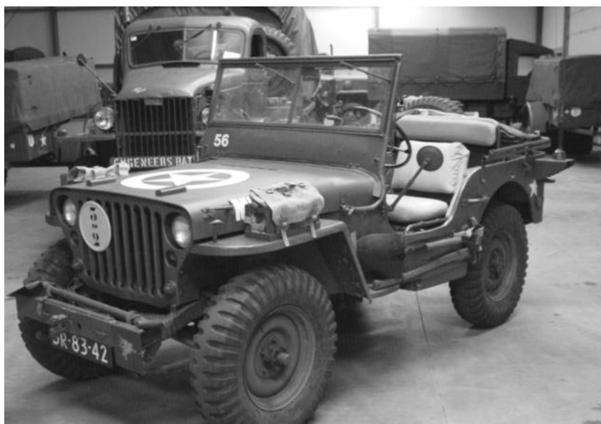
Een jeep mag ook, maar mag ook iets kleiner.