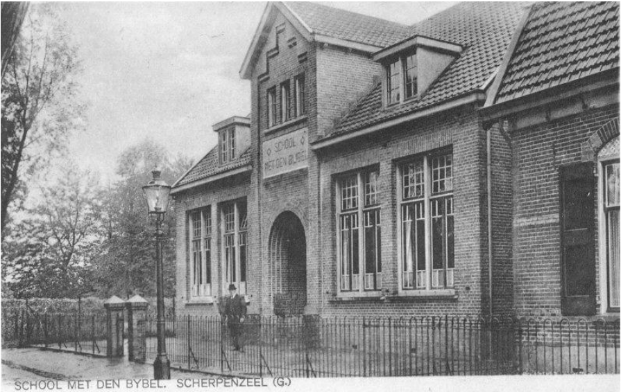
SCHOOL MET DEN BYBEL. SCHERPENZEEL (G)