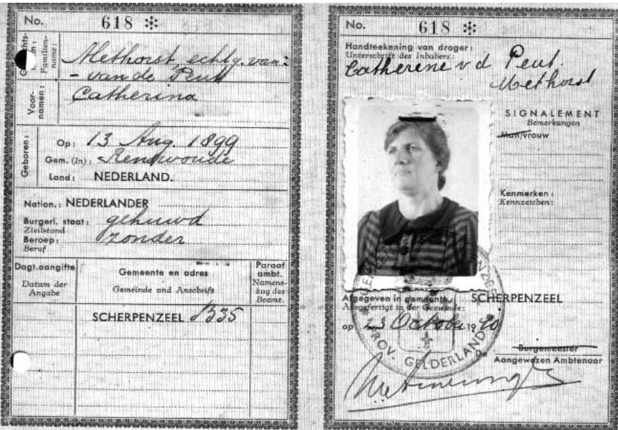
Sramkaart van moeder Van de Peut

aan de Barneveldsestraat. Grootvader was jachtopziener voor de familie Royaards en het huis aan de Barneveldsestraat is voor hem in 1899 nieuw gebouwd als jachtopzienerhuis. Mijn vader trouwde in, dat wil zeggen dat hij met mijn moeder ging inwonen in de boerderij. Dat was in 1928 en mijn grootvader was toen al overleden. Maar mijn moeder en grootmoe die konden niet zo goed met elkaar overweg. Bij het trouwen had mijn moeder wat nieuwe meubeltjes gekregen en die wilde zij natuurlijk in de kamer neerzetten. Hiervoor moesten wat oude meubeltjes van opoe opzij geschoven worden, maar opoe schoof de nieuwe meubels net zo hard weer terug en zette haar meubels weer op de oude plek! Dat was de reden dat moeder op stel en sprong weer vertrok en terugkeerde naar haar eigen ouders, die in Ederveen woonden.