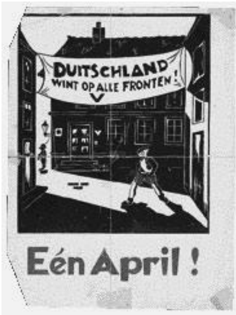
Affiches en (spot)prenten.

Hier volgt een greep uit de voorwerpen die soms opduiken bij een opruiming. We houden ons aanbevolen!