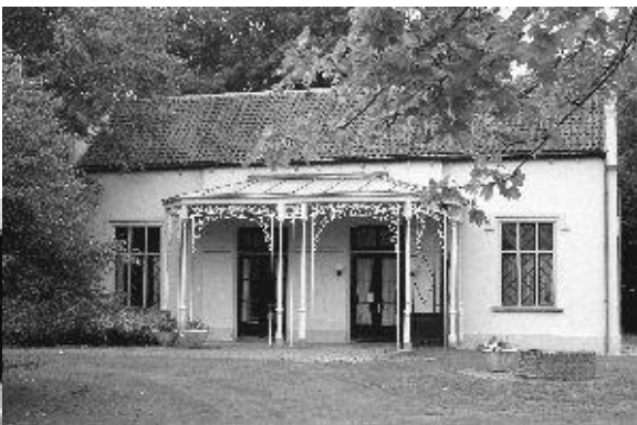
Het Koetshuis, ingang oostzijde.

Ingang zuidzijde voor toegang tot o.a. het Documentatiecentrum.