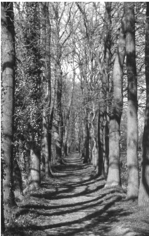
De Lambalgerkeerkade is begroeid met hoge eiken. Hier een beeld van traject 4 in maart 2003.

Vroeger, en dat duurde tot na de Tweede Wereldoorlog, was er eikenhakhout. Dat had voorheen een hoge gebruikswaarde. Het leverde brandhout, o.a. voor bakkersovens, en de schors diende als grondstof voor run waarmee je leer kon looien. De eiken van het hakhout werden regelmatig gekapt (ongeveer eenmaal in de tien jaar). De onderstammen, stobben of stronken liepen na de kap uit en nieuwe eikenstammetjes groeiden op.