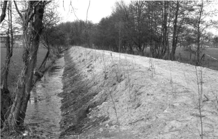
Het pas herstelde traject 5 van de kade in maart 1977.

De soortenarme kruidlaag van traject 5 is een gevolg van het recente ontstaan. Ongetwijfeld zullen zich in de toekomst meer soorten gaan vestigen, o.a. soorten van bosranden en bossen. Het voorkomen van grote brandnetel en speenkruid wijst op een wat voedselrijkere bodem vergeleken met die van het vorige traject.