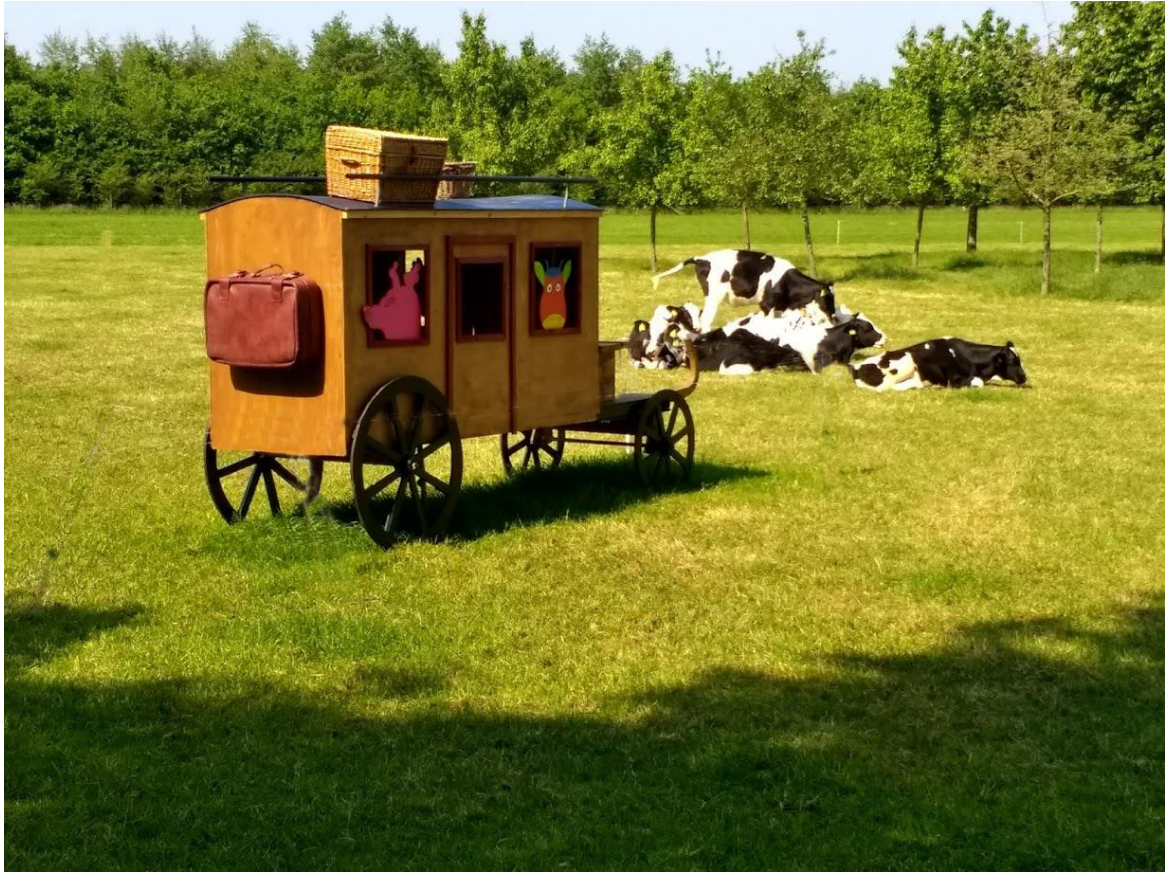
De Glazen Wagen. Een van de objecten in de Kunstroute 'Scherpenzeel oud?'