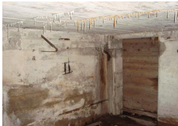
interieur met originele! houten toegangsdeur