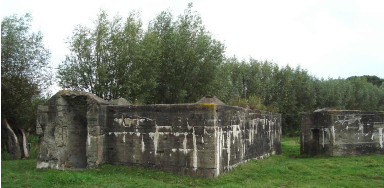
bunker 51.245746, 3.399556, verblijfsruimte met mitrailleurpost (re); uitvoering Marine, in gewapend beton

De naam 'bunker' werd in die tijd overigens nog niet gebruikt. De Belgen en Nederlanders spraken van 'kazematten', de Duitsers onder andere van 'Unterstände' of 'Stützpunkte'; de Belgische volksmond sprak wel van 'onderstande'