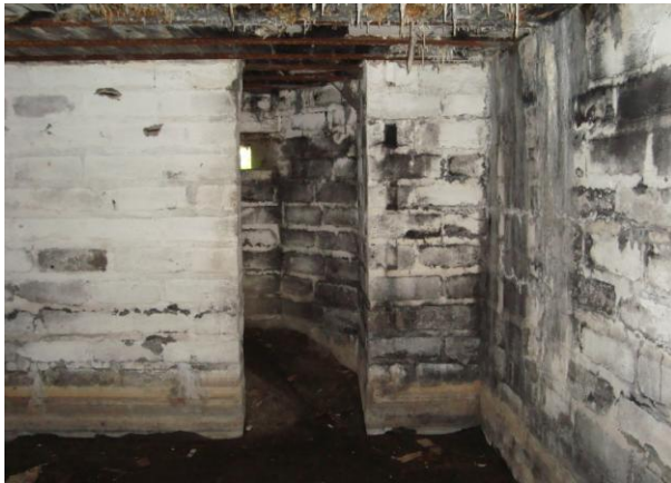
type IV, tussenwand naar schietgat