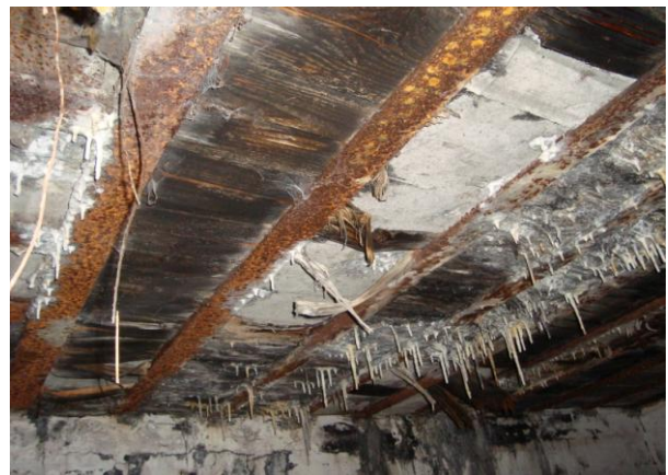
constructie van het plafond

Onze verdere tocht bracht ons naar Boekhoute, een rustiek vissersplaatsje op 't droge. Dat is niet cynisch bedoeld. Bij de ingang verkondigt een bord trots 'enige vissersplaats op het land'. Tot de dertiger jaren bleek het dorpje uit te varen op de oude Braakman in Zeeuws-Vlaanderen. Op het plein een druk bezochte kerk, toeristen stroomden in en uit. Nieuwsgierig sloten wij ons - ietwat schichtig, ik beken het eerlijk - aan bij de godsvruchtige menigte. Binnen in de beide zijbeuken echter een schitterende expositie over de Eerste en de Tweede wereldoorlog. Cultureel multi-functioneel gebruik. De kundige gids wist bescheid. Die bunkers in Kluizen maakten deel uit van de zogeheten Hollandstelling.